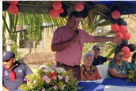
Impunidad de alcaldes sandinistas es "una carga de dolor insoportable" para familiares de asesinados