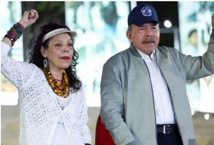
Régimen Ortega-Murillo actúa como caja de resonancia de China para "protegerse" de EE. UU.